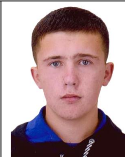
Мудрик Микола Богданович (17.12.1999)